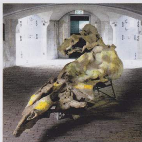
Maartje Korstanje: 'Zonder titel' (2010-15).